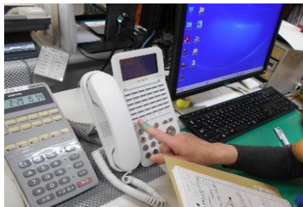
相談員からの連絡・指示の様子