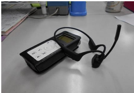
インカム本体と骨伝導マイクイヤホン

【インカム】を導入したことで、ご利用者様の状況や処置対応の確認がリアルタイムで可能となり、業務の効率化を図ることができています。