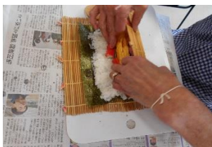
「上手く巻けるかしら?それっ!」

2月の調理プログラムは季節柄【恵方巻】と【やしょうま】に挑戦しました。「もう節分だね」「豆は地豆(落花生)をまく?」「うちは大豆だよ!」「やしょうま、もう数年食べてない。懐かしいね!!」と季節感のある調理を楽しまれました。3月は雛祭とお彼岸に合わせてちらし寿司やおはぎも予定しています。