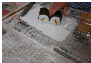
今年の恵方巻出来上がり