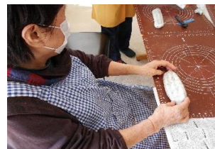
青のりとゆかり味のやしょうま