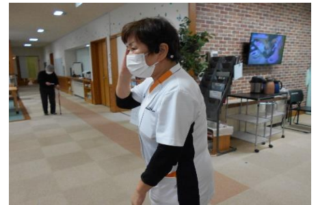
ご利用者様の状況報告の様子