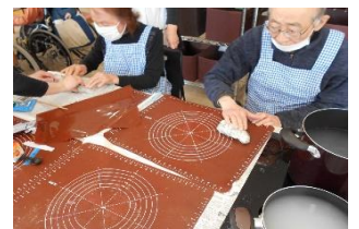
初めてのやしょうま作りに 真剣な表情