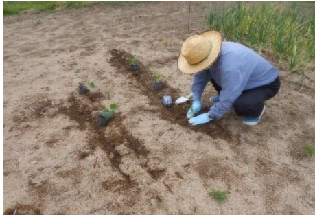
野菜の苗植え付け

昨年収穫した綿(わた)から種を取り出してもらい、畑に蒔きました。畑に行く事が難しい方も、センターでできることに参加し、「畑どうだった」「草取りしてきたよ」等関心を持っていただいています。