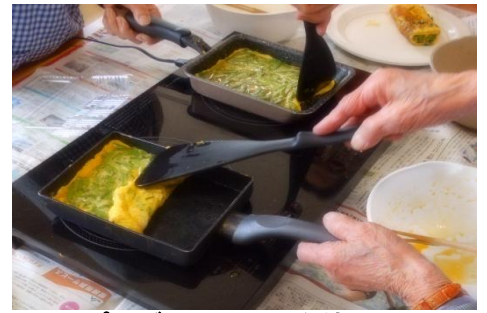
調理プログラムでにらを使用しました