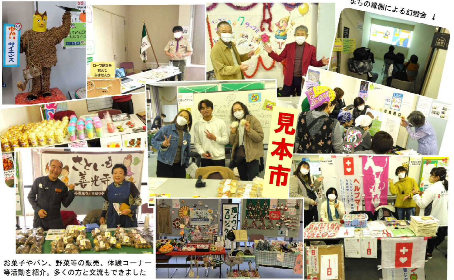
まちなぎによる幻燈会 ↓