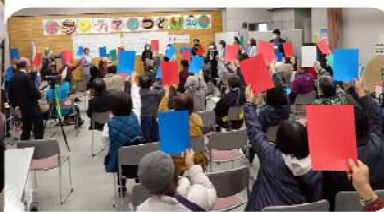
↑勢いある旗揚げで意思統一！