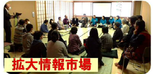
↑ 会場の飾りつけは、学生ボランティアさんのアイデア！明るく楽しい雰囲気