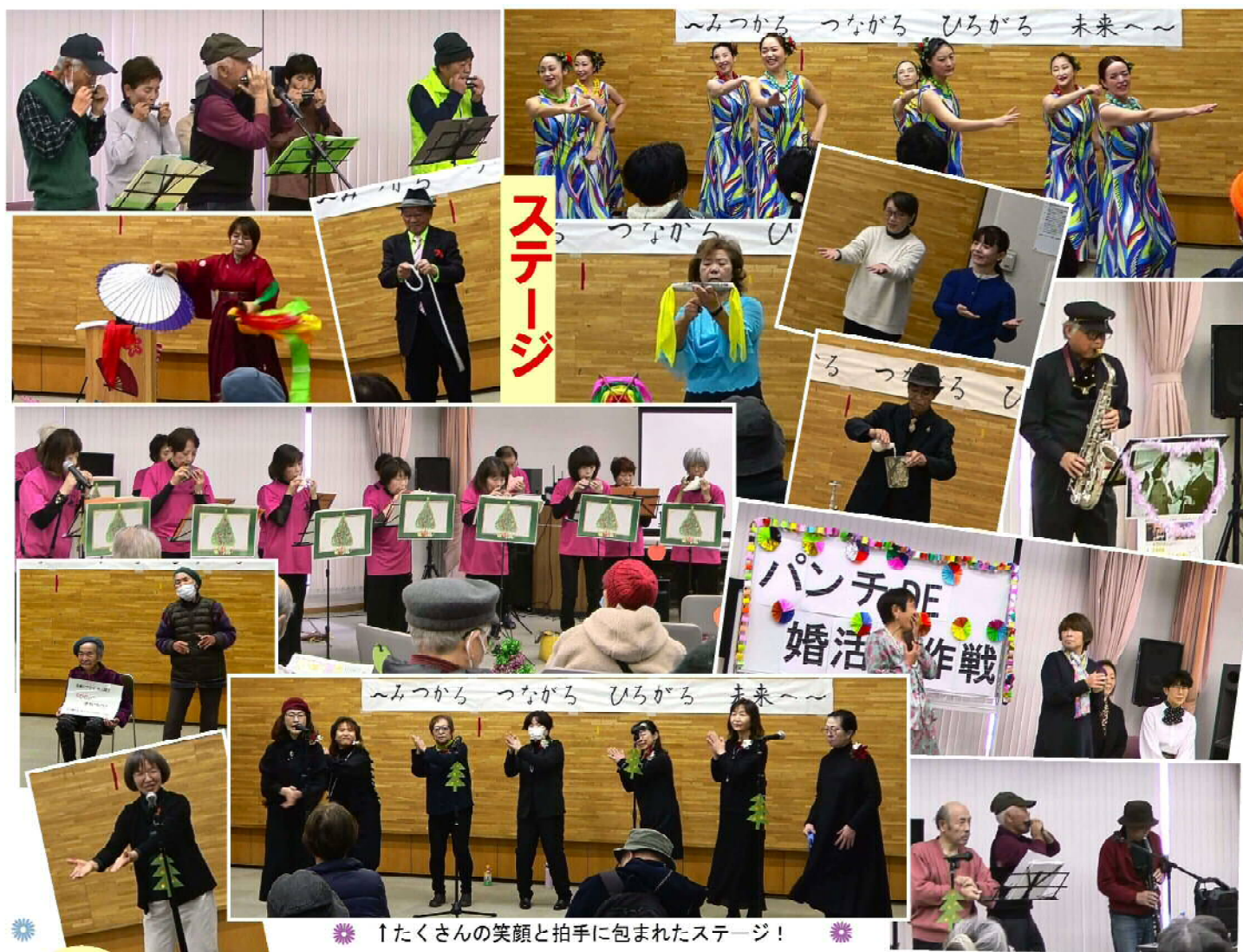
↑たくさんの笑顔と拍手に包まれたステージ！