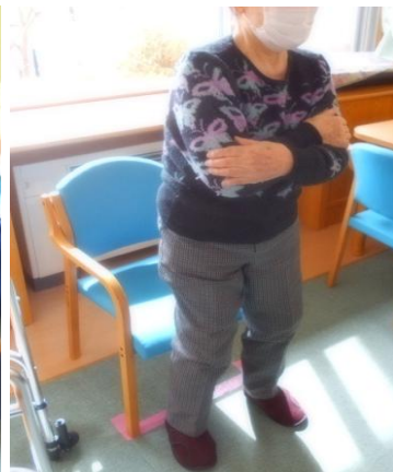
5回椅子立ち上がり