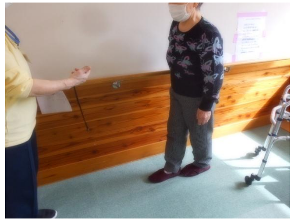
タンデム立位保持