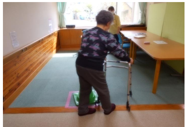
TUG(Time Up and Go Test) 障害物を周っての歩行テスト。向きを変えたときにふらつく方が多く見られました。