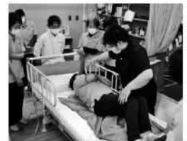
▲職員の資質向上のために研修を行っています。