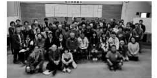
▲長野市ボランティアセンターでは、ボランティアグループの交流と、市民の皆様がボランティア活動を始めるきっかけづくりとして、毎年「ボランティアのつどい」を開催しています。