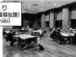
地区の活動計画会議の様子。(大豆島地区) ▶ 地域の課題解決に取り組みます。