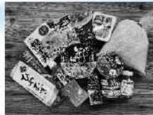
▲フードドライブを実施してご寄付いただいた食料