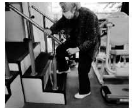
▲通所介護で日々の機能訓練の様子。

介護が必要になったり、当たり前のように暮らしてきた日常生活が難しくなった時でも安心して在宅生活が送れるよう、私たちは通所介護(デイサービス)、訪問介護、居宅介護支援等の事業所を運営し、地域での暮らしを支えています。 通所介護では、ご本人が「やってみようかな」と自発的に取り組める活動づくりに力を入れ、地域のお店や事業所と協力したエコバック等の作成や農作業など、これまでの経験や得意なことを活かして地域の方々と関わることができる機会も設けています。 訪問介護では、介護保険サービスに加えて障害のある方の支援にも取り組み、外出が難しい視覚障害のある方の通院や買い物などの支援も行っています。また、長野市の事業を受託してヤングケアラーの支援にも力を入れています。 居宅介護支援では、ケアマネジャーがご利用者やご家族の「思い」や「生活スタイル」を大切にしながら、可能な限り住み慣れた地域の中で自立した日常生活を営めるよう支援しています。