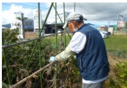
きゅうり棚の片付け

くりのみ園でお借りしている畑も秋らしくなりました。利用者様ときゅうり棚を片付け、大根の間引きをしました。間引いた大根菜はセンターで分け合いました。また今年も綿を収穫しています。綿に付いたごみを取り除く作業は座ってできるので、体操など活動の合間をみて多くの方に行っていただいています。さつまいもの茎も丁寧に皮むきをしていただき、子ども食堂での一品になりました。畑に行かれない方も座ってできることを探して活動に参加していただいています。