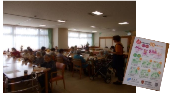
火災予防啓発チラシの読み合わせをしながら、 話し合いをしました