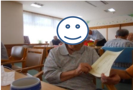
ご長寿節目・100歳超えの方々を表彰しました 「自分でもびっくり」と笑顔で話されていました

9/16-9/22が防災運動週間のため、「敬老の日」のお祝いに併せて、長野市消防局よりご依頼の「高齢者を火災から守る運動」啓発活動を行いました。チラシを配布し読み合わせ、ご家庭での危険やいのちを守る行動についてみなさんと考える機会になりました。おひとり住まいのご利用者様も増えていきますので、防災週間だけでなく日常から声掛けをしてまいります。