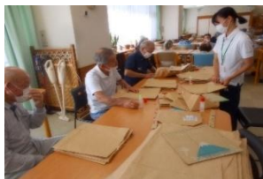
エコバッグの納品をしながら、 リーフレット・ポスターの配布 を行いました

「認知症とともに生きる希望宣言(日本認知症本人ワーキンググループ)」の一節『自分の力を活かして、大切にしたい暮らしを続け、社会の一員として、楽しみながらチャレンジしていきます』この言葉を実践できるよう支援します。