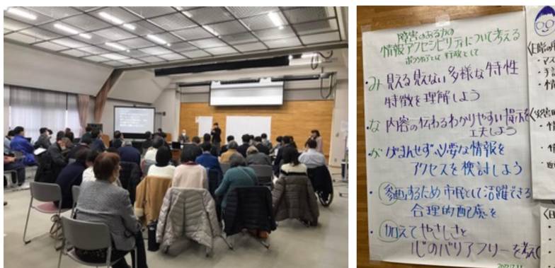
昨年の市民会議の様子

長野市ボランティア連絡協議会とは、ボランティア活動を通して社会福祉の向上、充実を図り地域に寄与する活動をするとともに、ボランティアの連絡調整・相互啓蒙・親睦を図っています。団体会員16団体、個人会員26名で構成されています。