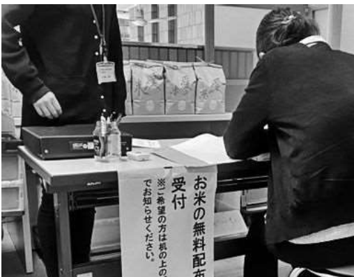
↑食料支援の申し込みをご利用者に代わって

去年の12月に「まいさぼ長野市」で配布された「愛の米」や各種食品を、一人では外出することが困難で食糧支援を必要とするご利用者に代わってケアマネジャーが受け取り、ご自宅へお持ちしました。「地域の皆様の温かいお気持ちがかもったお米と食材ですよ。」とお渡ししたところ「皆様の気持ちが本当に嬉しいね。これで良い年が迎えられそうだよ。」と、とても喜ばれました。