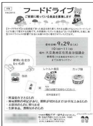
↑最初に呼びかけた際のチラシ

自分の住む地区に提供できる場があることで、「ちょっとしたものだけで…」と言って持つてきてくださる方もいました。