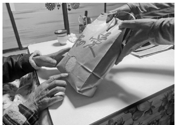
↑笑顔で受け取ってくださいました