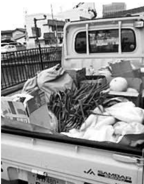
↑大根やゴボウ、キャベツなど

今後は地区内の民生委員・児童委員との連携を進めていきたいと語っておられました。民生委員・児童委員と連携することで、地区内で困っている人と食材を直接つなぐことができるかもしれません。活動の広がり新たな取組に期待です！