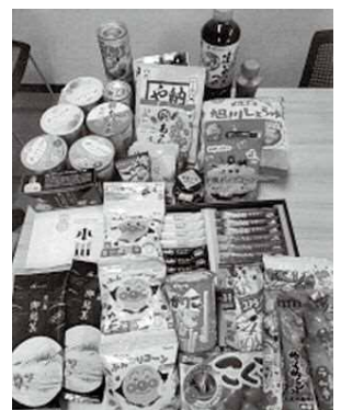
↑集まった食品、調味料や子ども用のお菓子など